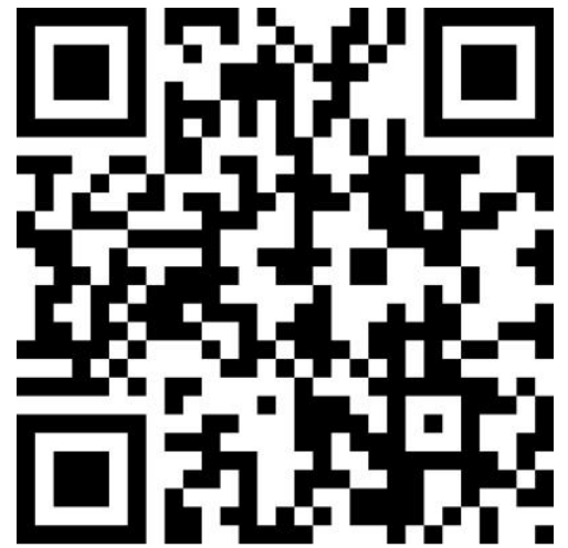
Digitaler Antrag auf Streikunterstützung

Die Streikerfassung erfolgt dann am Streiktag durch Abscannen, des individuellen QR-Codes, den du erhältst.